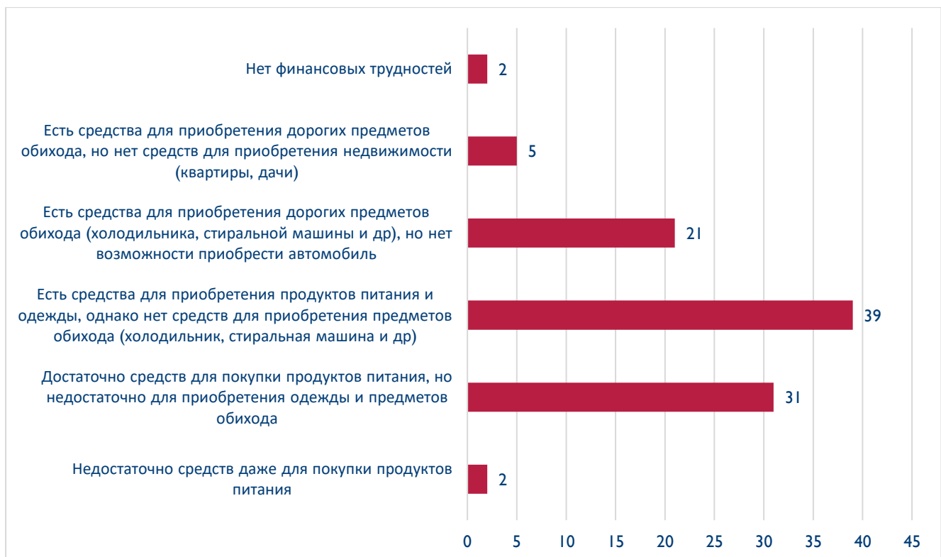
Диаграмма 1. Финансовое положение семьи респондентов – маятниковых мигрантов, участвующих в анкетном опросе на территории КР (в процентном соотношении, рассчитанном из общего числа респондентов (N=100))

Важно отметить, что лишь 2% опрошенных относятся к категории нуждающихся людей, то есть их заработок до начала маятниковой миграции в КР был способен покрыть лишь потребности питания их семьи/домохозяйства. В результате анкетирования было выявлено такое же число респондентов (2%), которые не имеют материальных сложностей (способны приобрести дом/квартиру в РУ), однако тоже заинтересованы в трудовой деятельности и заработке на территории КР.